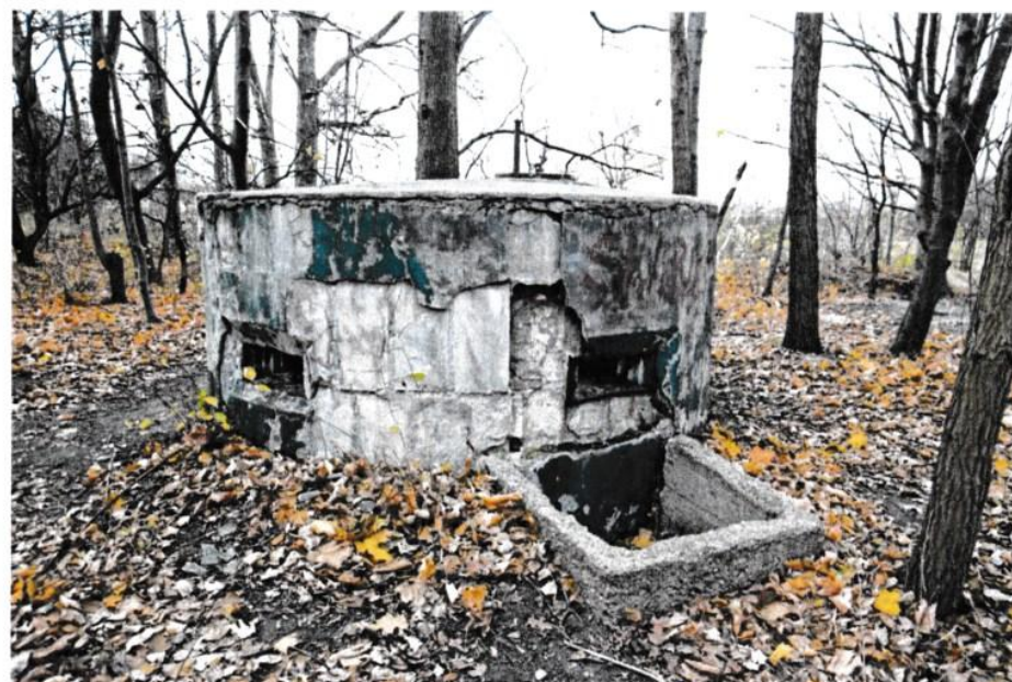
Fot. 2 – widok na kopułę dalocelownika na schronie dowodzenia 27. BAS