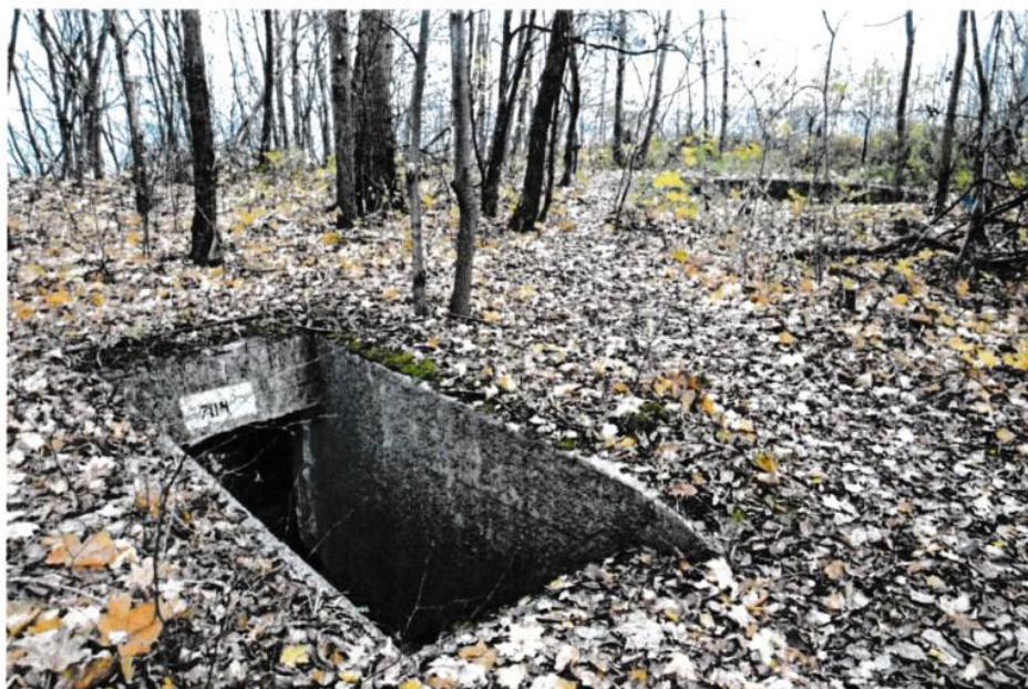
Fot. 1 – widok zejścia do systemu korytarzy łączących stanowiska ogniowe 27. BAS

Zespół obiektów szczególnie wartościowy.